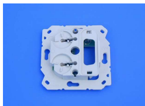
Module de base 125.0100