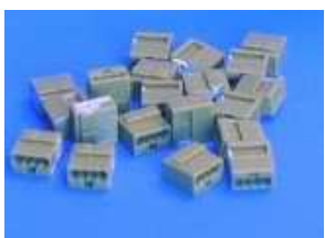
Bornes Wago 141.5840